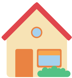
EL USO DE AGUA EN 11 MILLÓN + CASAS

¡Contribuye a construir un futuro sostenible encontrando y reparando fugas hoy mismo!