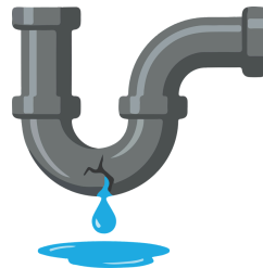
FUGAS DOMÉSTICAS SIGILOSAS